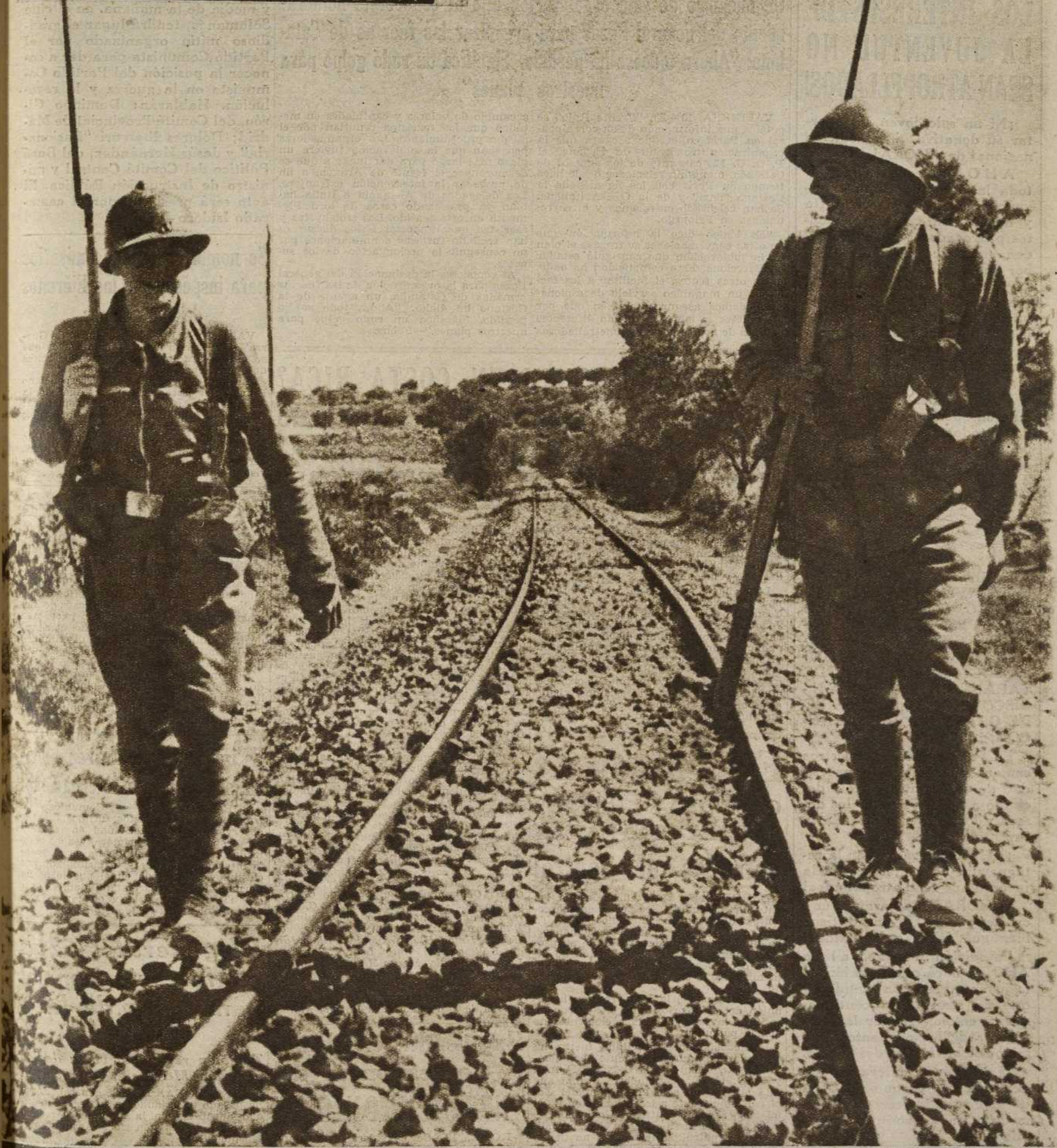
VETERANOS DE NUESTRA GUERRA, JOVENES CENTINELAS DEL EJERCITO DEL PUEBLO, VIGILAN LAS LINEAS LEALES CONTRA TODA POSIBLE AGRESION ENEMIGA...