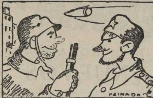
—Ha sido desarticulada la organización fascista. —¡Claro, se ha desarticulado por la "Falange"!