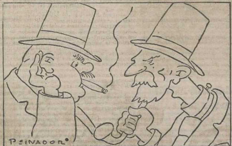
—¿Ha dicho usted no intervención? —Dije no intervención. —Creí que decía usted no intervención.

El almirante inglés de la escuadra del Mediterráneo, tan pronto como conoció el accidente y el magnífico comportamiento del personal de la escuadra española y de las tripulaciones de las embarcaciones pesqueras almerienses se ha apresurado a testimoniar su agradecimiento al Gobierno de la República y a las autoridades de la escuadra republicana.—Febus.