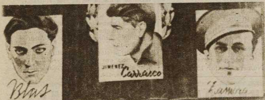
Pancartas en las calles de Madrid... La juventud exige el castigo implacable de los traidores. La J. S. U. del Sector Norte espera que toda la juventud recoja su llamamiento para aplastar conjuntamente a los rebeldes asesinos del pueblo

LAS JUVENTUBES LIBERTARIAS NO TIENEN NADA QUE VER CON LOS ASESINOS DEL PUEBLO MUERTE A LOS PROVOCADORES. J.S.U. S. N.º