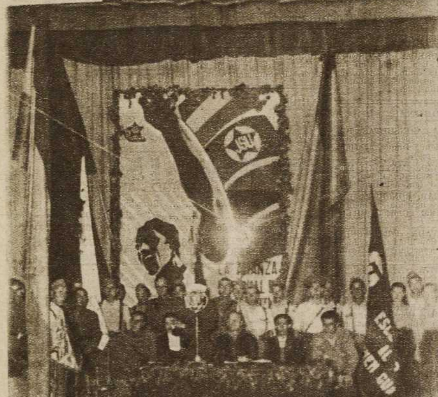
El glorioso batallón Joven Guardia ha celebrado un acto en el que sus combatientes, para ser fieles a los héroes caídos en la lucha, han prometido velar, cueste lo que cueste, por la Alianza Juvenil