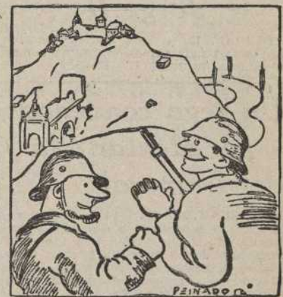
—¡Qué cerca se ve Toledo, Nemesisio!

Sin novedad en el resto del frente. Febus.