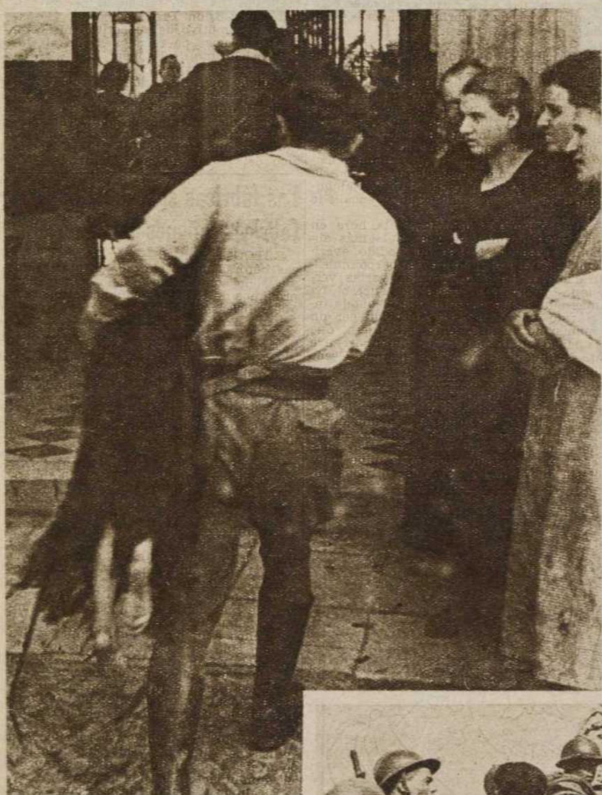
Guardias civiles heridos como consecuencia de la batalla del Santuario... Filas interminables de prisioneros llenos de hambre, de miseria y de enfermedades... En los brazos de los amigos del pueblo que ahora, el Ejército del pueblo se lleva hasta los hospitales y Sanatorios