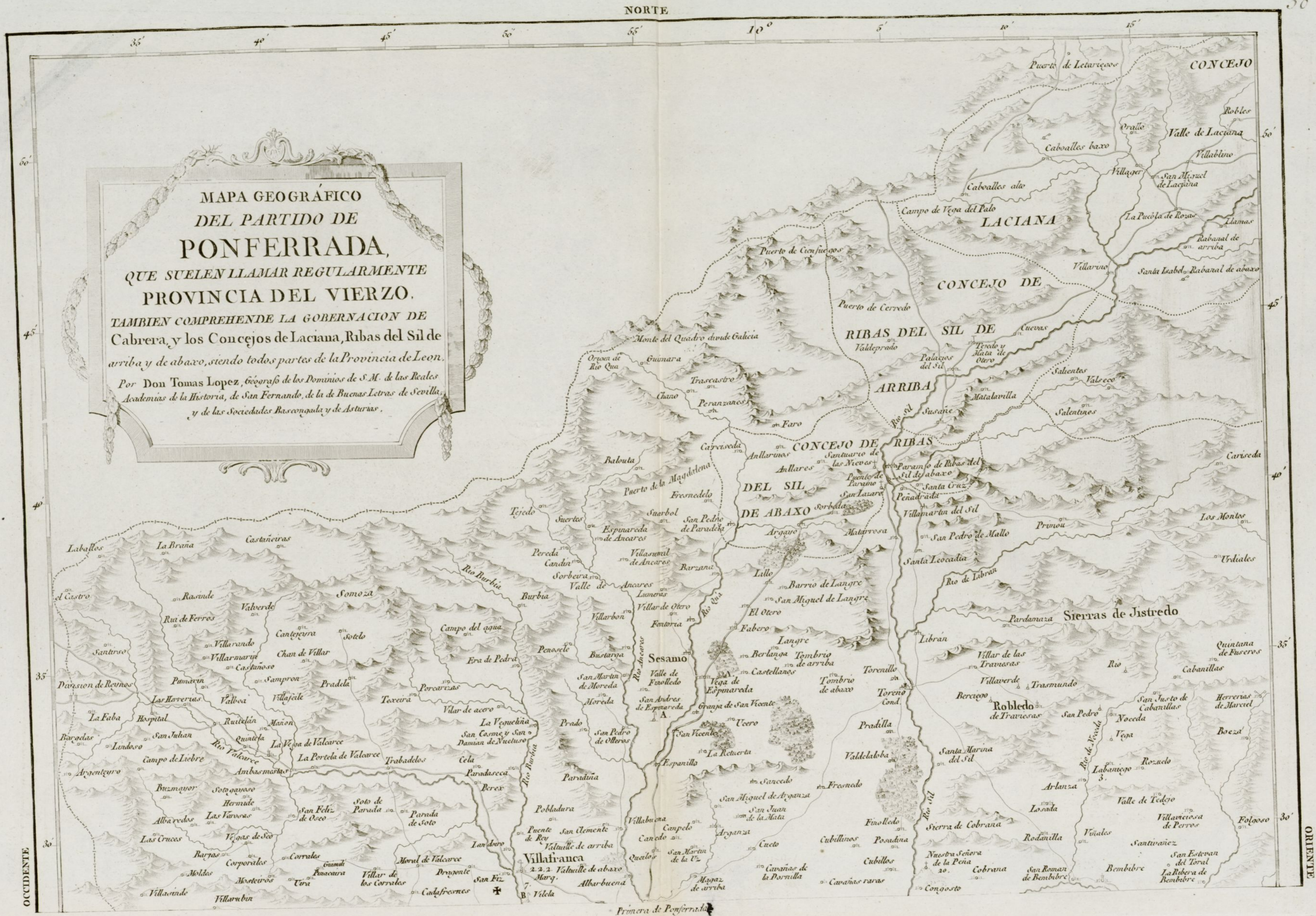
MAPA GEOGRAFICO DEL PARTIDO DE PONFERRADA, QUE SUELEN LLAMAR REGULARMENTE PROVINCIA DEL VIERZO. TAMBIEN COMPREHENDE LA GOBERNACION DE Cabrera, y los Concejos de Laciana, Ribas del Sil de arriba y de abajo, siendo todos partes de la Provincia de Leon. Por Don Tomas Lopez, Geografo de los Dominios de S. M. de las Reales Academias de la Historia, de San Fernando, de la de Buenas Letras de Sevilla, y de las Societales Bascongada y de Asturias.