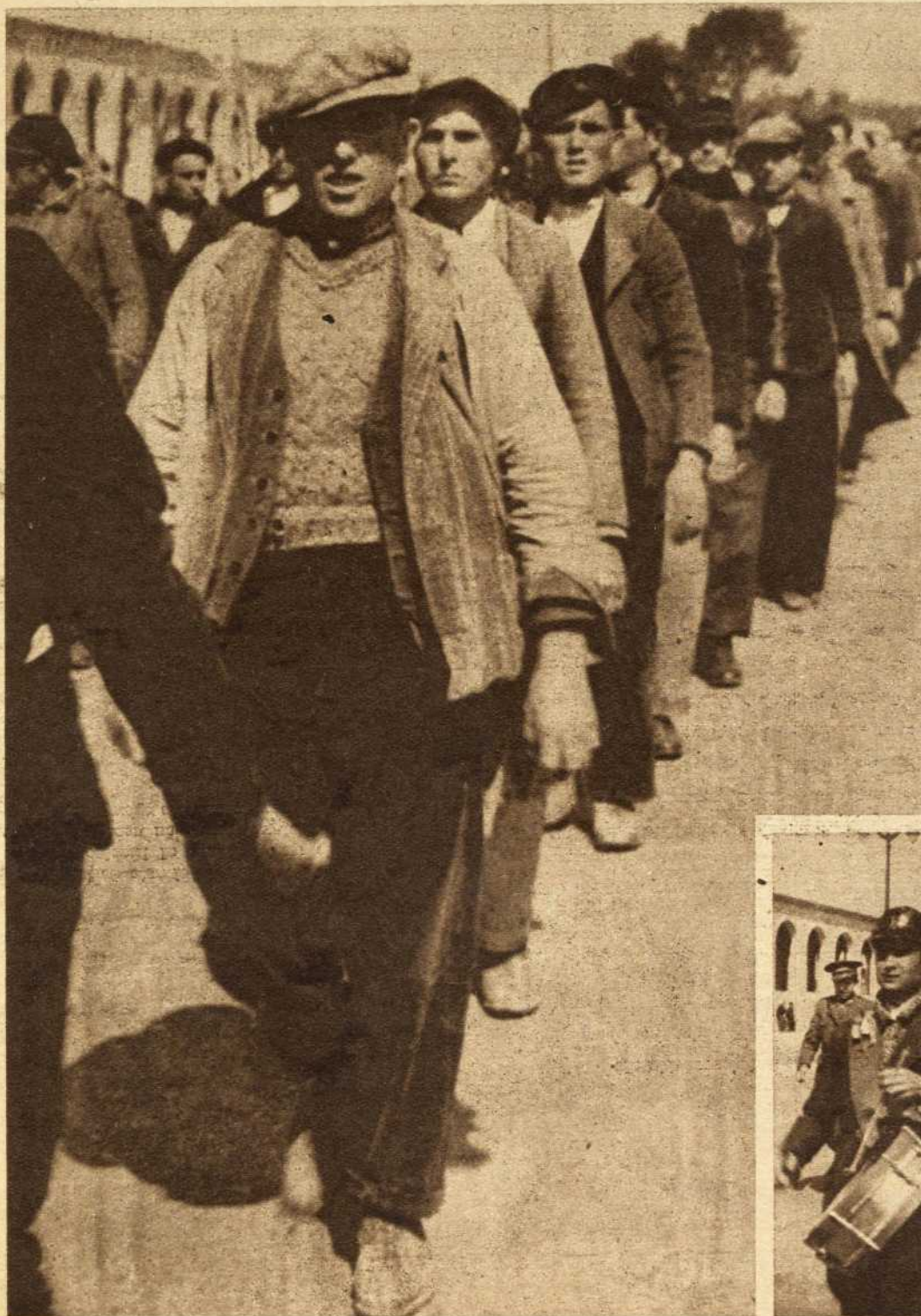
Los campesinos reservistas se preparan para defender sus campos. Los obreros, para defender sus fábricas. Todos, para defender España

¡Joven español! ¿Tú conoces las tierras de España? ¿Conoces Salamanca? ¿Conoces nuestro Toledo, nuestro Santiago de Compostela, nuestra Córdoba? Pues de todas estas tierras y estas ciudades orgullo nuestro salen hacia Italia los cuadros de nuestro Greco, las esculturas de nuestro Berruguete, las cartas de nuestro Gran Capitán, los autógrafos de nuestro Cervantes. De todas estas tierras salen nuestro vino, nuestro aceite, nuestros minerales. Si Italia nos conquistase, en los labradíos sólo trabajarían los esclavos de Italia para los "señores" italianos. A nuestros campesinos y a nuestros obreros los matarían o los enviarían, obligados por el hambre, a las guerras imperialistas de Mussolini. Pero los jóvenes españoles somos fuertes y, como en Tríjueque, venceremos. Para que el pan de España sea para los españoles y las canciones de España puedan volver a cantarse en toda nuestra Patria, queremos que nos movilicen a todos. ¡Todos los jóvenes españoles iremos a la guerra para traer la paz, la independencia y la alegría!