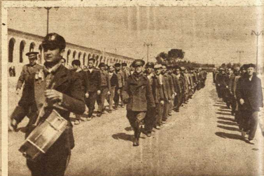
Llegan en grupos indisciplinados y pasan inmediatamente, por su voluntad de ser soldados, a desfilan con perfección