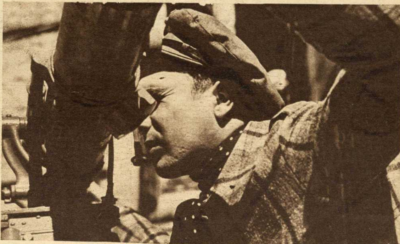
Trincheras altas y limpias de la Universitaria. Tiradores vascos de Ortega. La mañana ha comenzado con el repique de una ametralladora que se llama "la Lechera"... En el tejado de una casa, que es de ellos, los morteros del pueblo han comenzado una tarea eficaz...