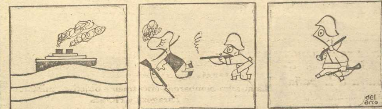
ITINERARIO DE UN FUSIL NACIDO EN ROMA