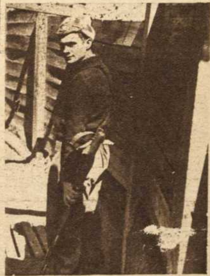
Trincheras de los héroes de Madrid. Tablas y baldosas mitigan la humedad y el fango de la tierra. En el pasillo largo se abren los túneles de los refugios y los desfiladeros de madera, con lonas recogidas, que servirán de toldo cuando llueva otra vez