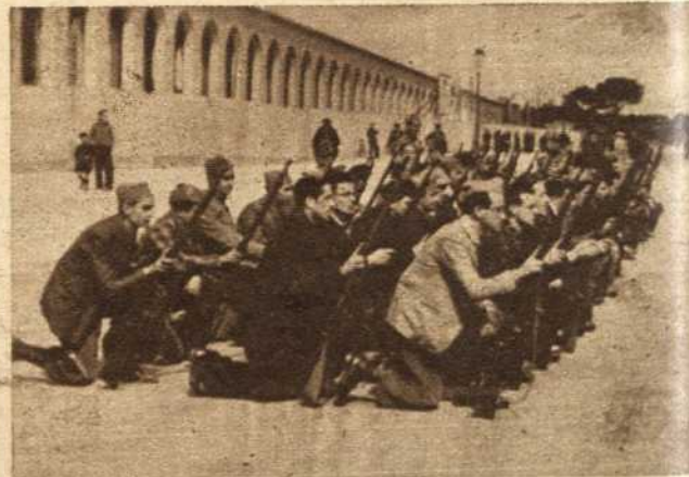
Los que se incorporaban sin una sola noción militar, ya son perfectos soldados, capaces de continuar las victorias de sus hermanos de Guadalajara