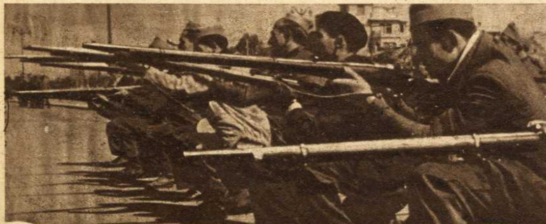
Para ganar la guerra vertiendo la menor cantidad de sangre posible. Para ello hay que convertir a los campesinos, obreros, intelectuales, en hombres que sepan la táctica de la guerra