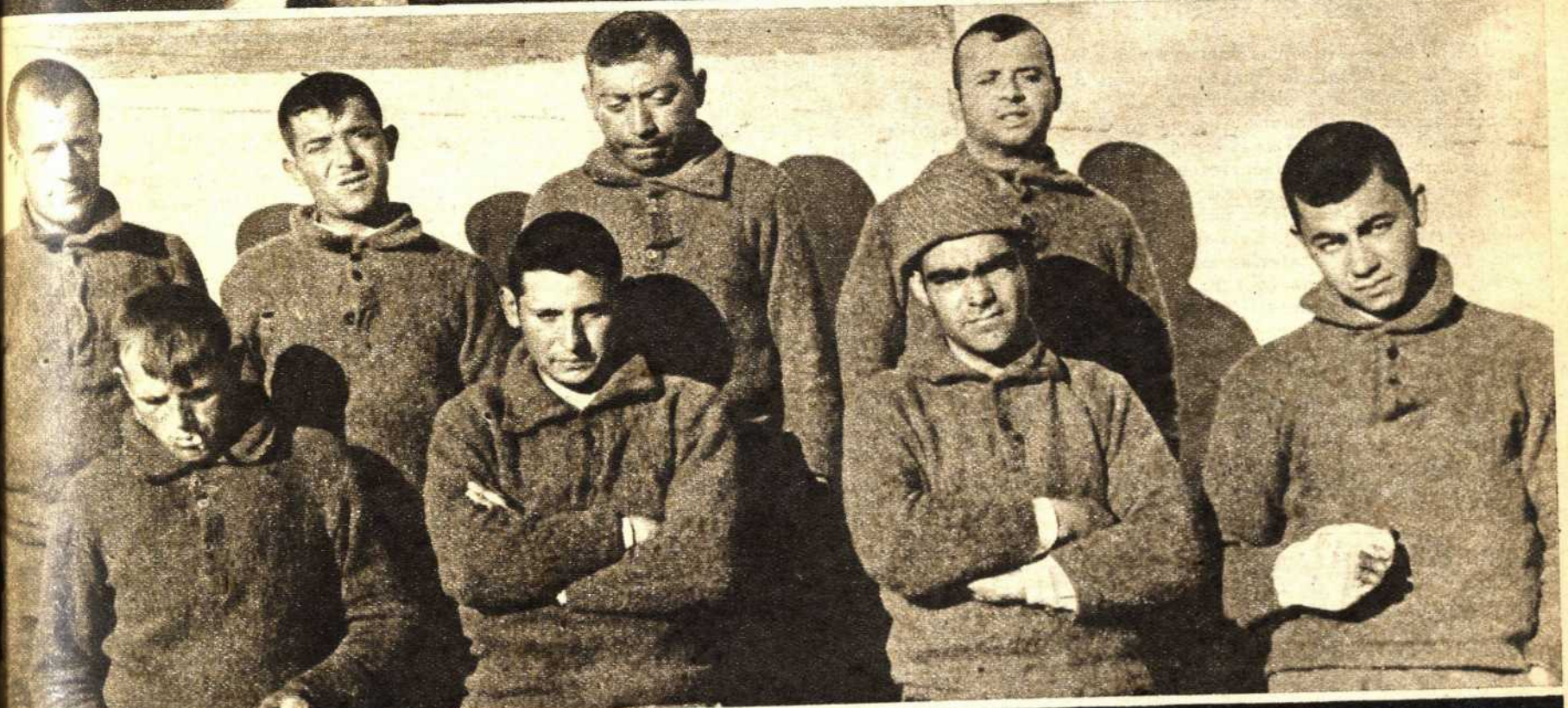
En el Jarama el enemigo no sólo ha sufrido la sangría de las bajas, sino también la de las evasiones en grupo. Mientras estos muchachos—en pleno combate—venían a las líneas del pueblo, el Ejército de la Libertad iniciaba su ofensiva en la Ciudad Universitaria. En la foto inferior—primer documento de las nuevas conquistas—, dos tanques leales avanzan tranquilamente junto al Instituto de Higiene. Nuestras bayonetas emprenden su marcha hacia adelante...