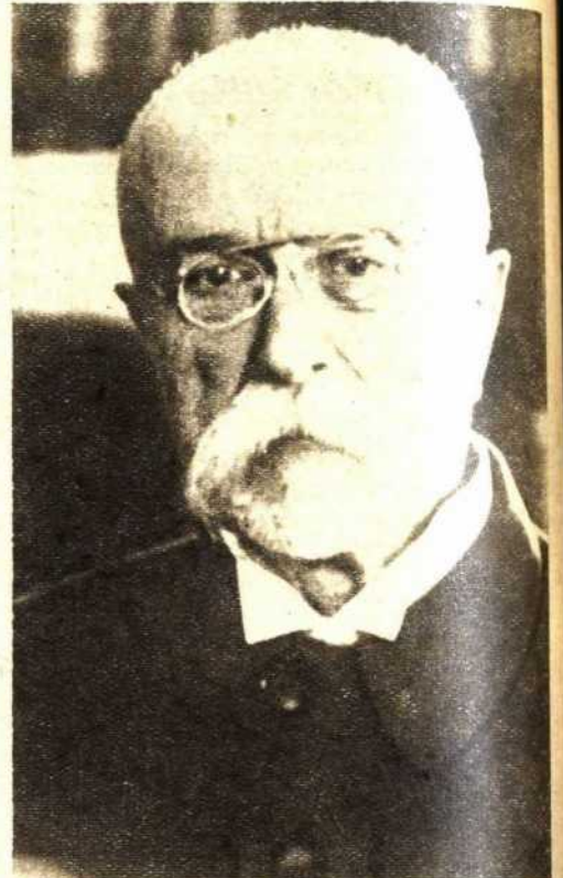
Massaryk, el gran demócrata checoslovaco, dedicó su vida de revolucionario a lograr la unidad de todas las nacionalidades de Checoslovaquia. La democracia checoslovaca es hoy un puntal de las libertades de todos los pueblos, y su pacto con la U. R. S. S. es algo que preocupa tanto a Hitler como la guerra española. El nacionalsocialismo pretende apoderarse de Checoslovaquia valiéndose de los grupos alemanes que existen en la nación. El pueblo de Checoslovaquia, siguiendo la tradición de Massaryk, está dispuesto a impedirlo