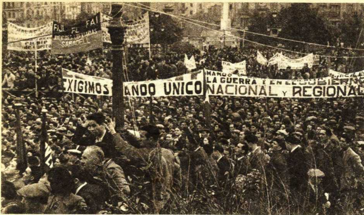
En Barcelona las Juventudes libertarias llenan las calles con una manifestación imponente. En grandes transparentes piden movilización, y le gritan a la juventud catalana: "Ante lo sucedido en Málaga, ¡juventud, en pie de guerra!" Otra de las pancartas dice: "Exigimos el mando único." Las consignas de la victoria son aclamadas por el pueblo