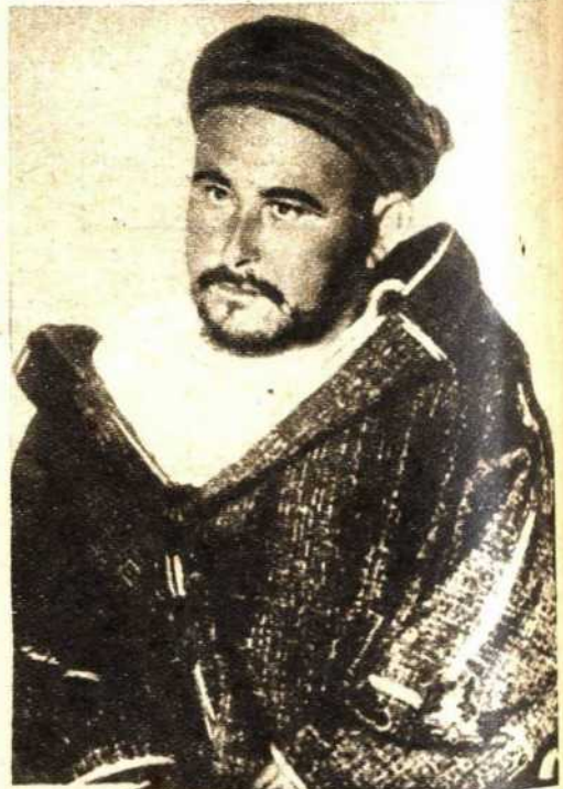
Abd-El-Krim, el jefe del nacionalismo marroquí. El Bloque de las Asociaciones Musulmanas de Orán protesta de la esclavitud a que Franco tiene sometidos a los moros de la zona española. Abd-El-Krim vuelve estos días a ser popular entre las masas moras que bajo su dirección combatieron por la independencia de Marruecos contra los mismos generales que hoy los utilizan como carne de cañón contra el pueblo español. Hoy estas gentes ven que la República, al defender sus libertades, defiende al mismo tiempo las del pueblo moro