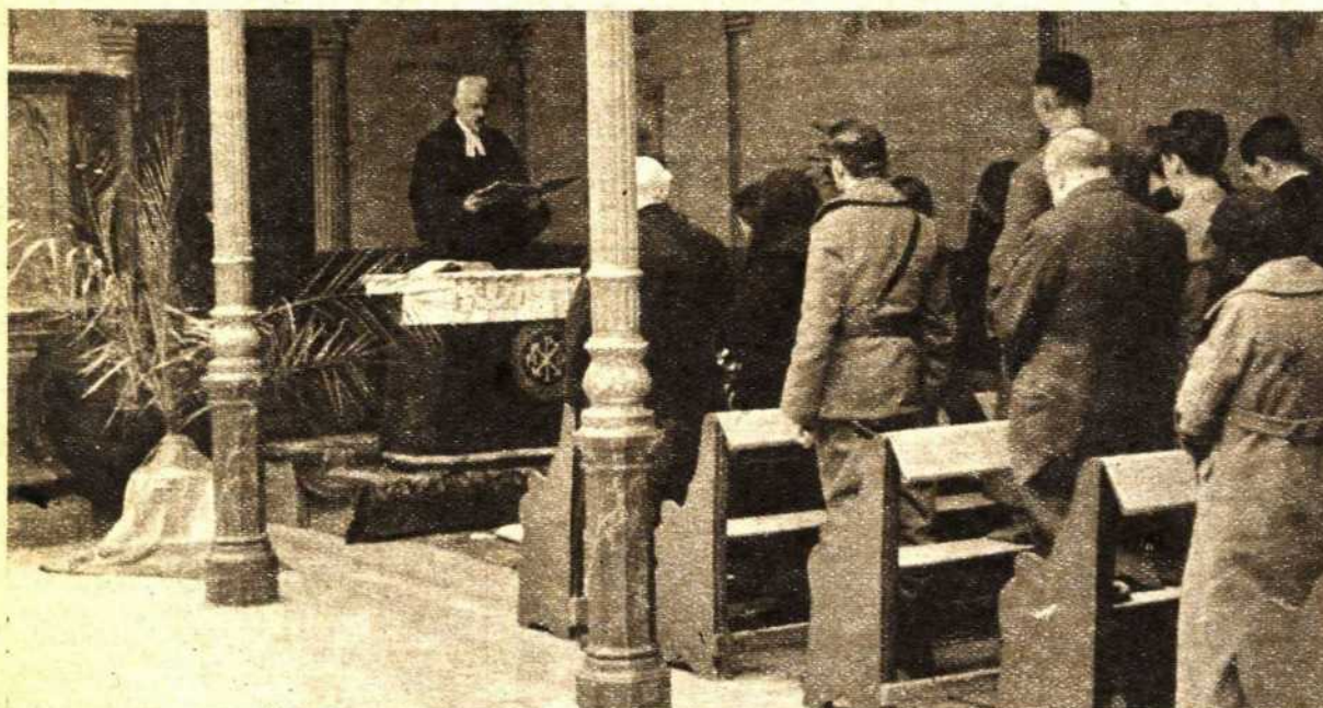
MISA EN MADRID.—Todos los domingos estos fieles protestantes celebran su misa, con toda devoción, en una capilla Evangélica de la capital en guerra. El estampido de los obuses, que estallan a menudo cerca de la capilla, no distrae la atención de los devotos; pero sirve para recordarles que—al otro lado de nuestras trincheras—unos hombres traidores continúan su labor tenaz de asesinato, agresión y guerra, en nombre de una religión que ellos mismos ultrajan y desprestigian con sus crímenes...