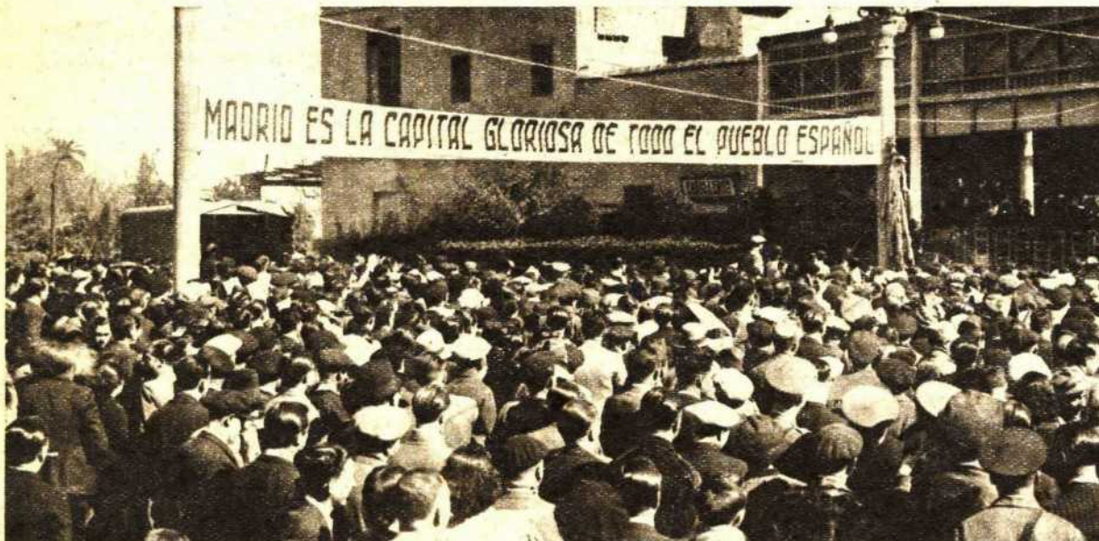
El pueblo de Valencia ha rendido un homenaje al heroico pueblo de Madrid. En el acto—celebrado en los Viveros—dió un concierto la Banda Municipal de la capital de España, que fué acogida por las aclamaciones entusiastas del pueblo levantino