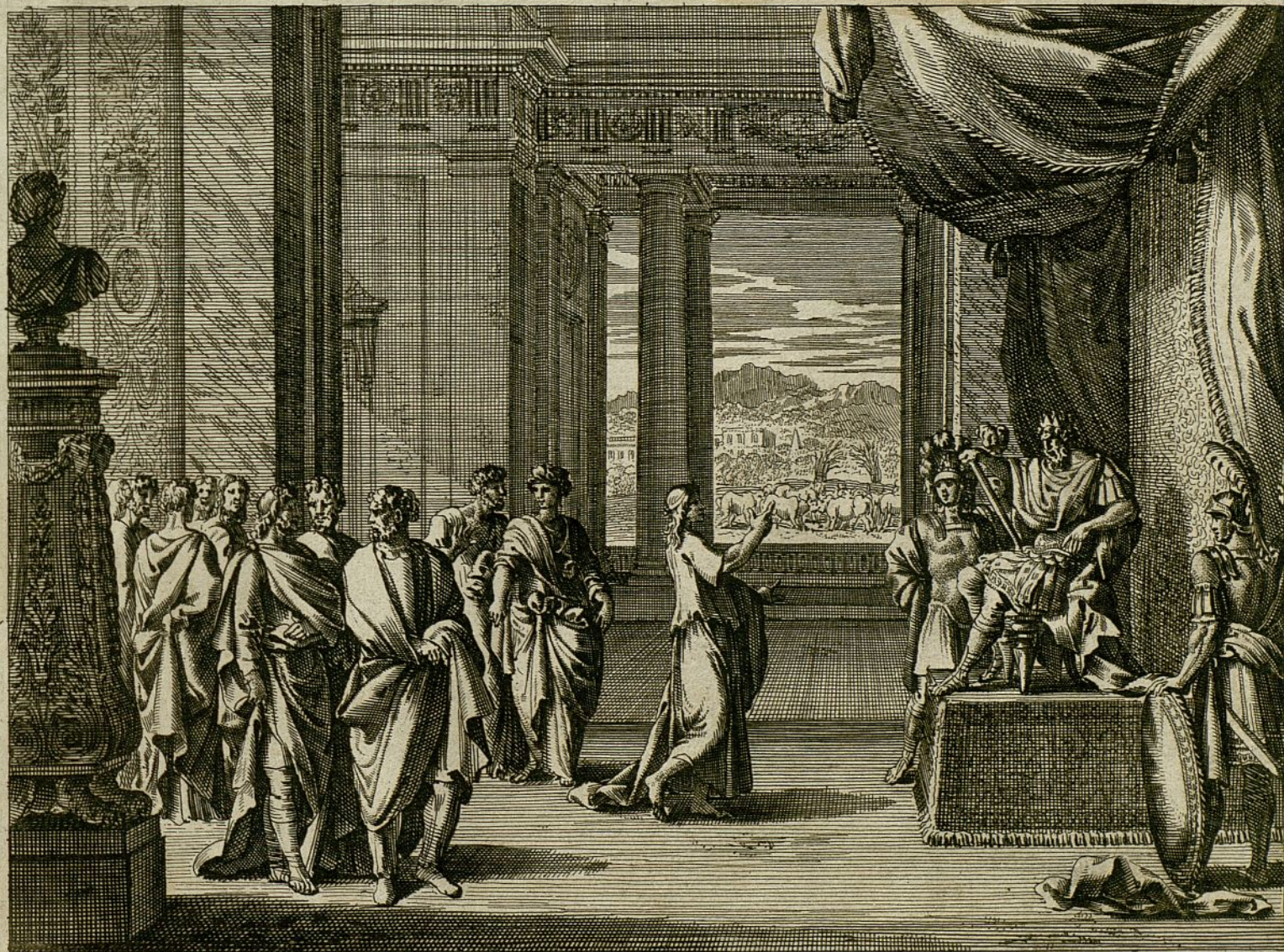
Le Pauvre se vend sous les Joseph explique les Songes de Pharaon. Charniers S t Innocent a P du Roy Joseph interprete les Songes de Pharaon Roy d'Egypte touchant les 7 ans d'abondance et les 7 ans de sterilité et indigence gen. 41.

MUSEE NATIONAL HISTOIRE NATURELLE PARIS 1793