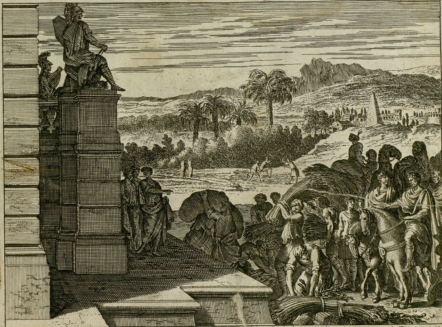
Le Pautre se vend sous les charniers, Joseph fait donner du bleds a ses Freres. Saint Innocent avec P du Roy Joseph se fait connoître a ses freres en Egypte les console les renvoie vers Jacob son Pere en Chanaan son Pais originair qui est la Palestine avec Chariots ames amasses bleds et autres dons par le commandement de Pharaon dont Jacob est surpris et grandement ravi gen. 45.