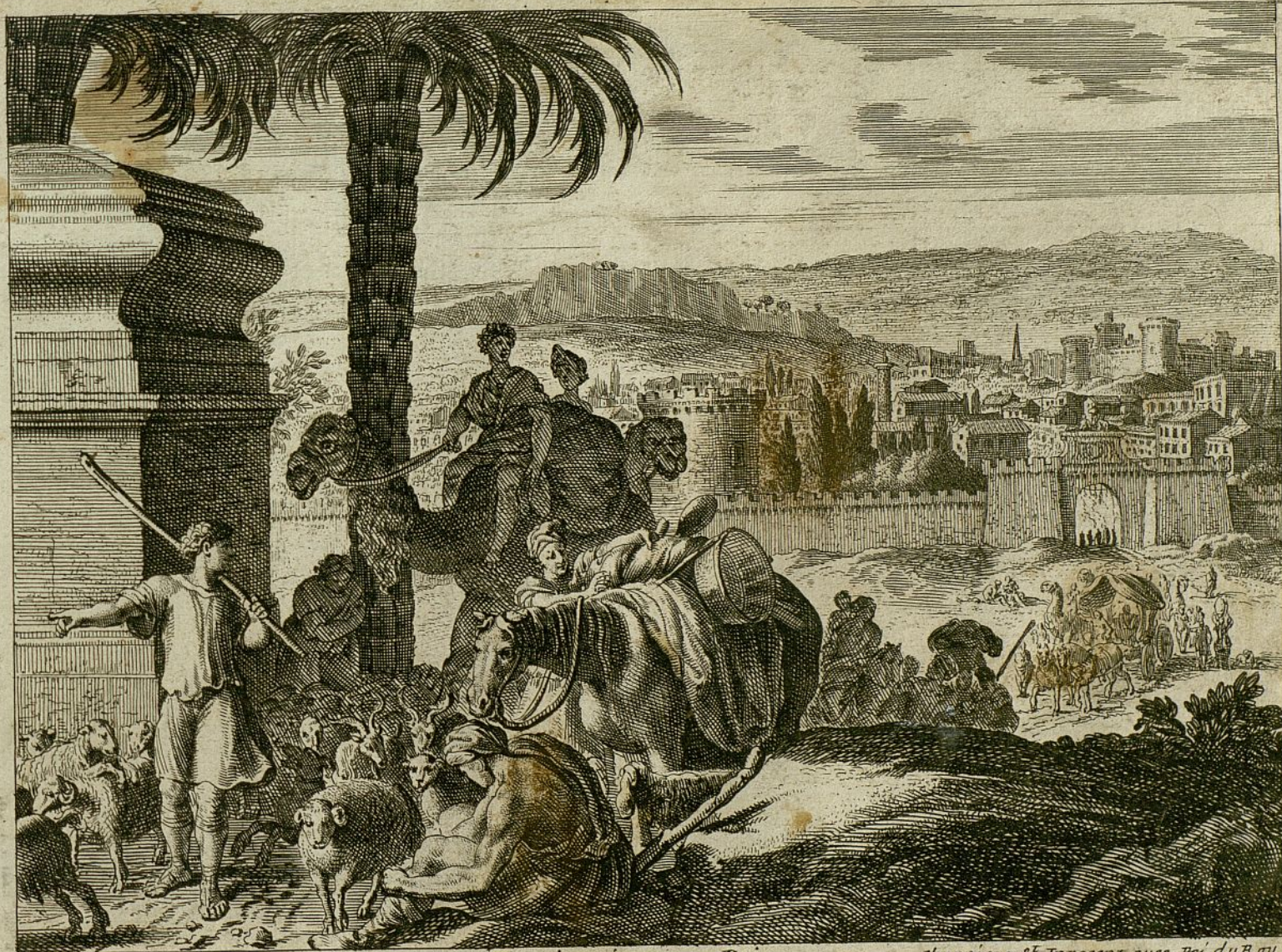
Le Pâtre ex et se vend sous les Jacob quitte son Pais. charniers S. t Innocent avec Pri. du Roy. Jacob quitte la terre de Chanaan a cause de la Famine pour aller avec sa famille et tous ses biens en la terre de Genren en Egipte — gen. 46.

BOUTILLIER G. BOUTILLIER F. BOUTILLIER G. BOUTILLIER F. BOUTILLIER