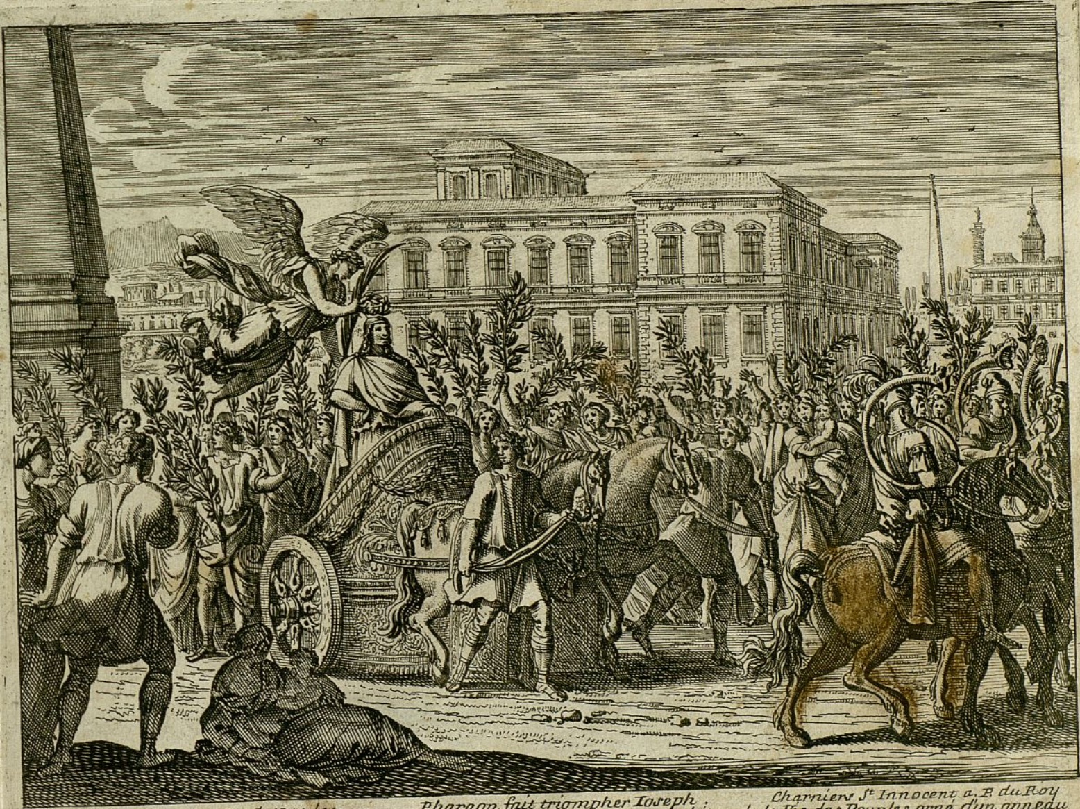
la Fautre ex et se, vend sous les Pharaon fait triompher Joseph. Charriers S t Innocent a. B du Roy Joseph estrangé et inconnu est établi Intendant du Royaume d'Égypte, Arbitre de la Vie des Peuples orné d'un anneau d'or avec le Sceau du Roy et d'une robe de Pourpre et conduit par les Provinces sur un Char de triomphe Gen. 41.