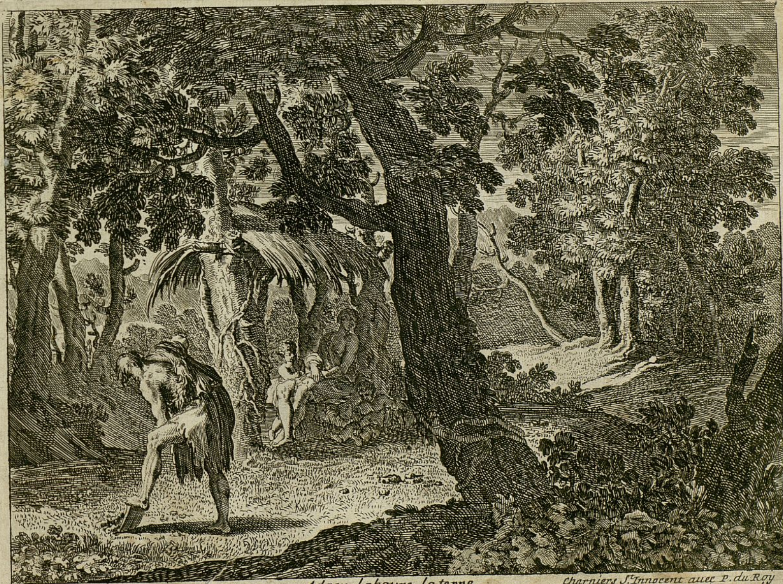
Le Pain se vend sous l'as Adam pour avoir desobey au Seigneur Dieu devient suiet de la douleur et du travail est obligé de labourer la terre de laglle il auoit été prin et den tirer sa nourriture en la sueur de son uirage tout les iours de sa uie gen. 3.