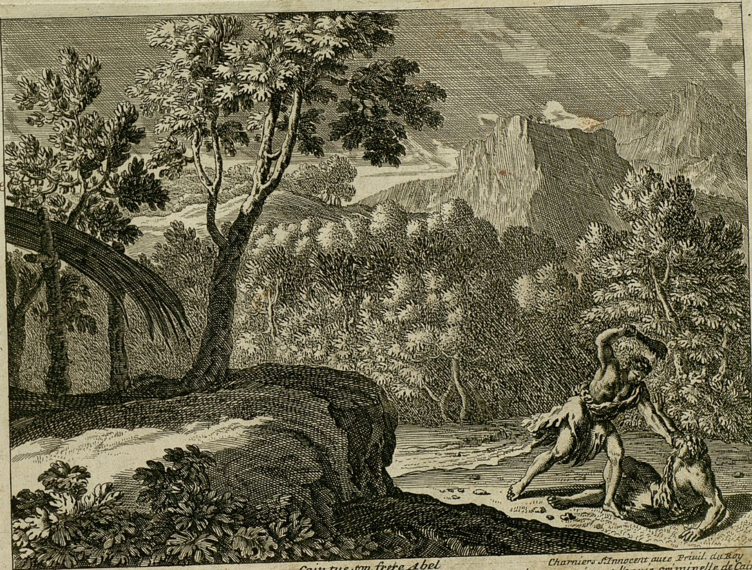
le Dautre en et se vend sous les Cain tue son frere Abel Cain se releue contre son frere Abel et le tue aux champs ou ils estoient sortis par la persuasion et l'enue criminelle de Cain Charniers Innocent avec Bruil. du Roy gen. 4.