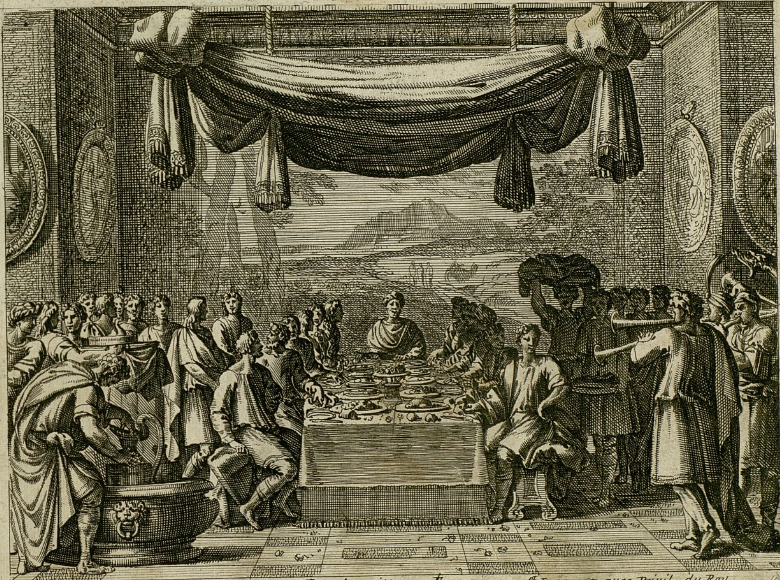
le pauvre, et se vend sous les charniers Joseph traite magnifiquement ses freres les Joseph traite ses freres. St Innocent avec Privil, du Roy les faisant souper a sa table et leur montrant beaucoup d'affection sans encoire se decouvrir nullement a eux gen. 43.