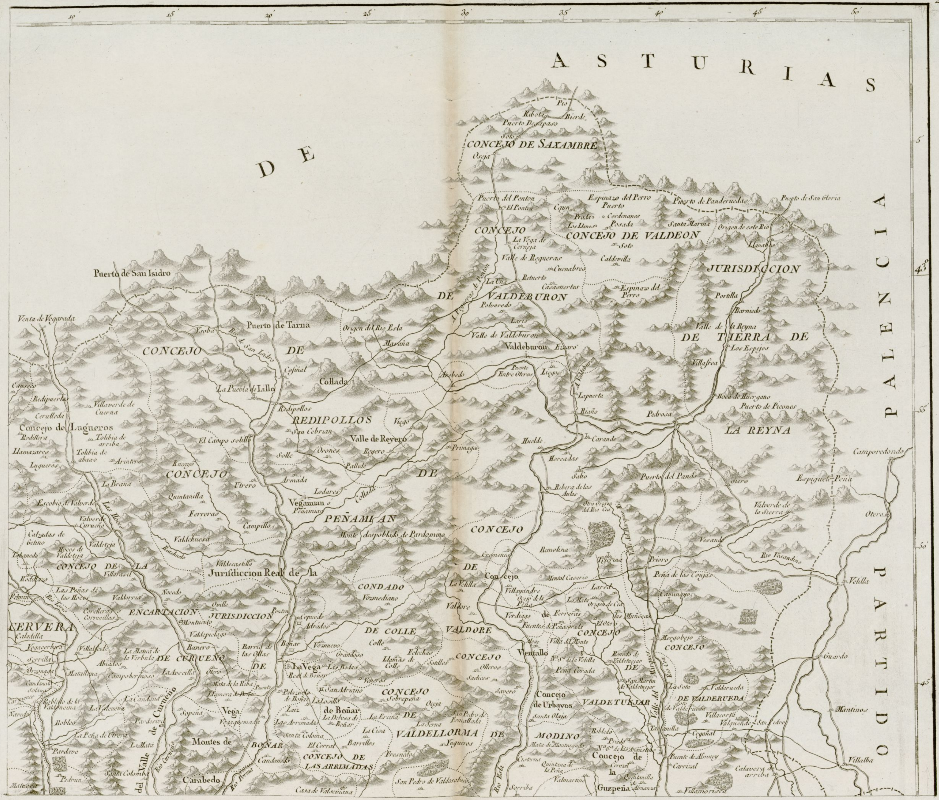
6.ª parte de Leon.