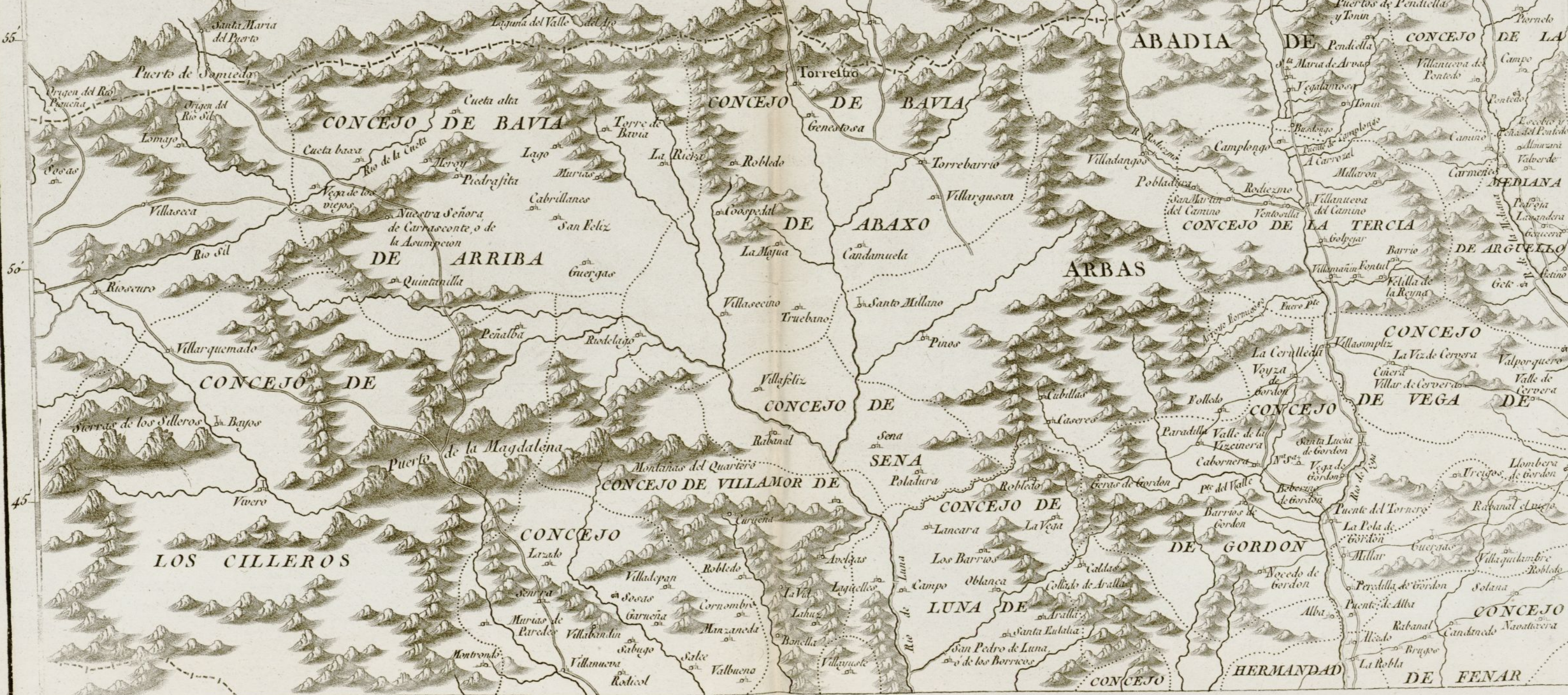
3ª parte de Leon.