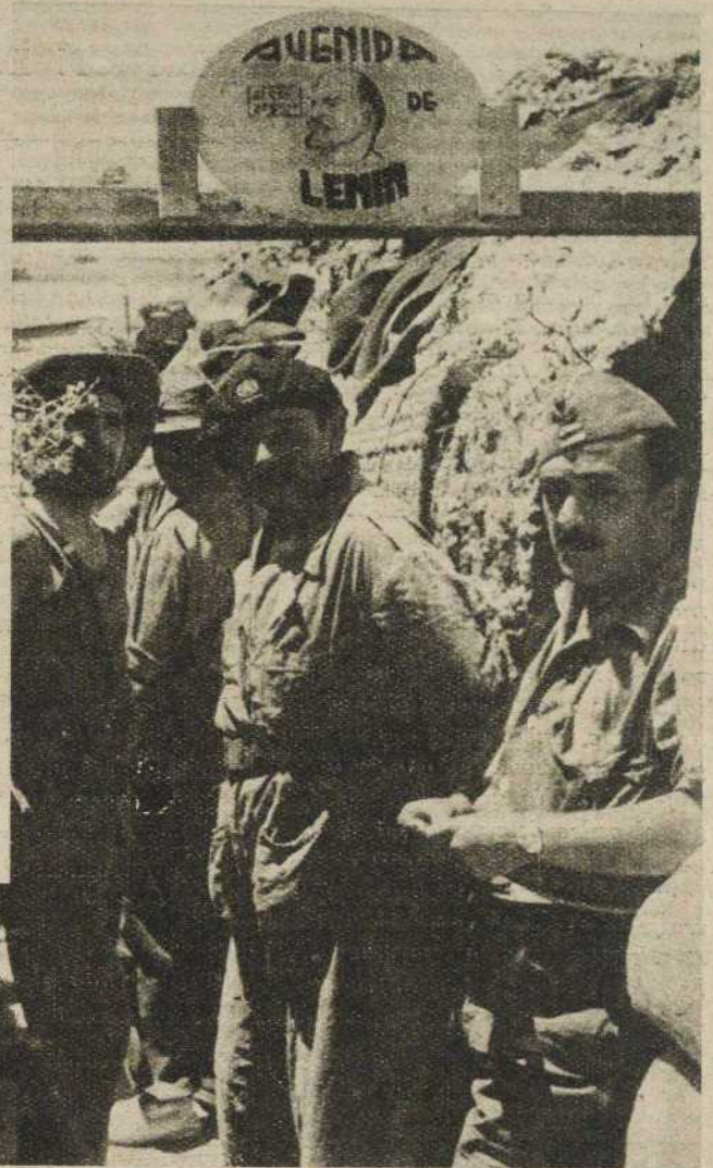
El cariño de nuestros soldados a los jefes del proletariado mundial se manifiesta de mil diversas maneras. Por eso han bautizado a su mejor callejón con el nombre de "Avenida de Lenin"