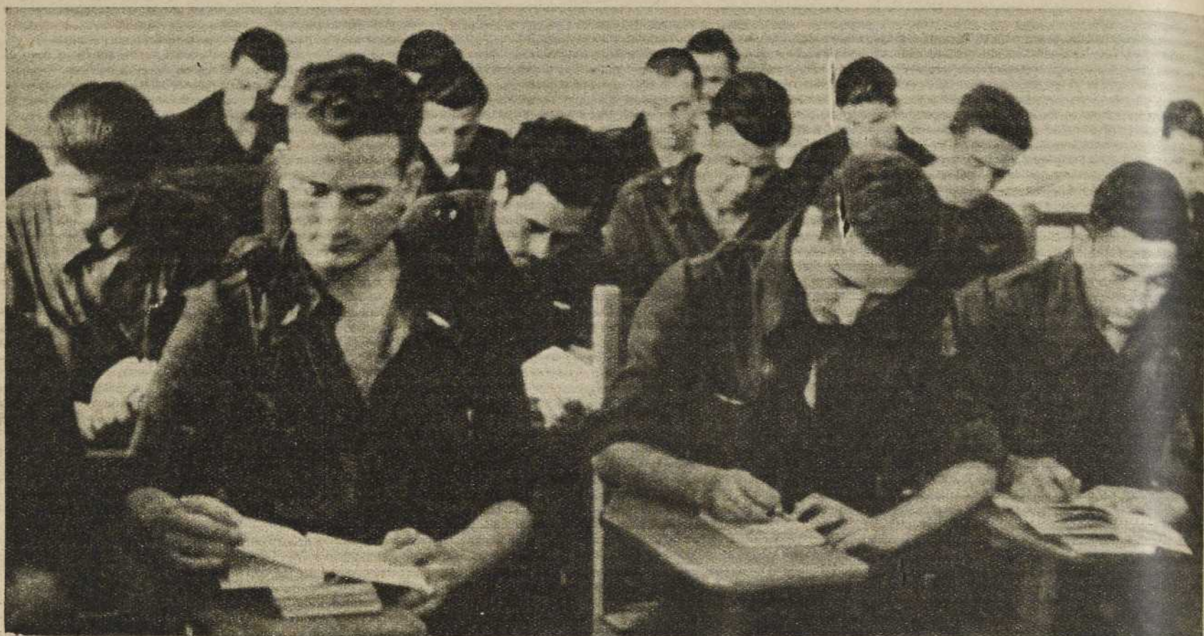
Los jóvenes trabajadores, deseosos de dominar la técnica, estudian con ahinco los arduos problemas de Matemáticas