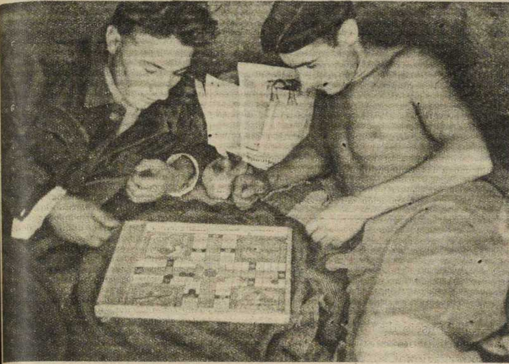
Los ratos de ocio serían insoportables si no se distrajeran de cualquier modo. Por eso, en las trincheras no faltan nunca libros, instrumentos de música, juegos...