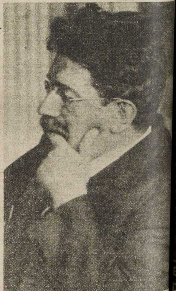
Las Internacionales proletarias se han reunido; de sus acuerdos, que parecen ser prometedores, depende grandemente la suerte del pueblo español y, como consecuencia, de los antifascistas del mundo. Marcel Cachin, a la izquierda, representa dicha reunión a la Internacional Comunista, y Federico Adler, a la derecha, a la Socialista