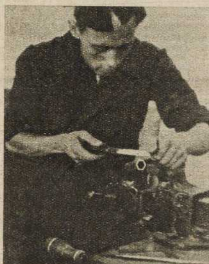
El futuro mecánico de Aviación ejecuta todos los trabajos que en la práctica de su profesión pueda serle preciso realizar

Para lograr la victoria es necesario poseer, al lado de un gran ejército, una potente industria de guerra. La juventud, lanzándose con brío a la conquista de la técnica, aplicándose en el conocimiento de sus secretos, debe cooperar activamente a dotar al país de una poderosa base industrial que ponga a nuestro Ejército en condiciones de asaltar victoriosamente las posiciones enemigas para incorporarlas ya de una vez a la España liberada del fascismo invasor.