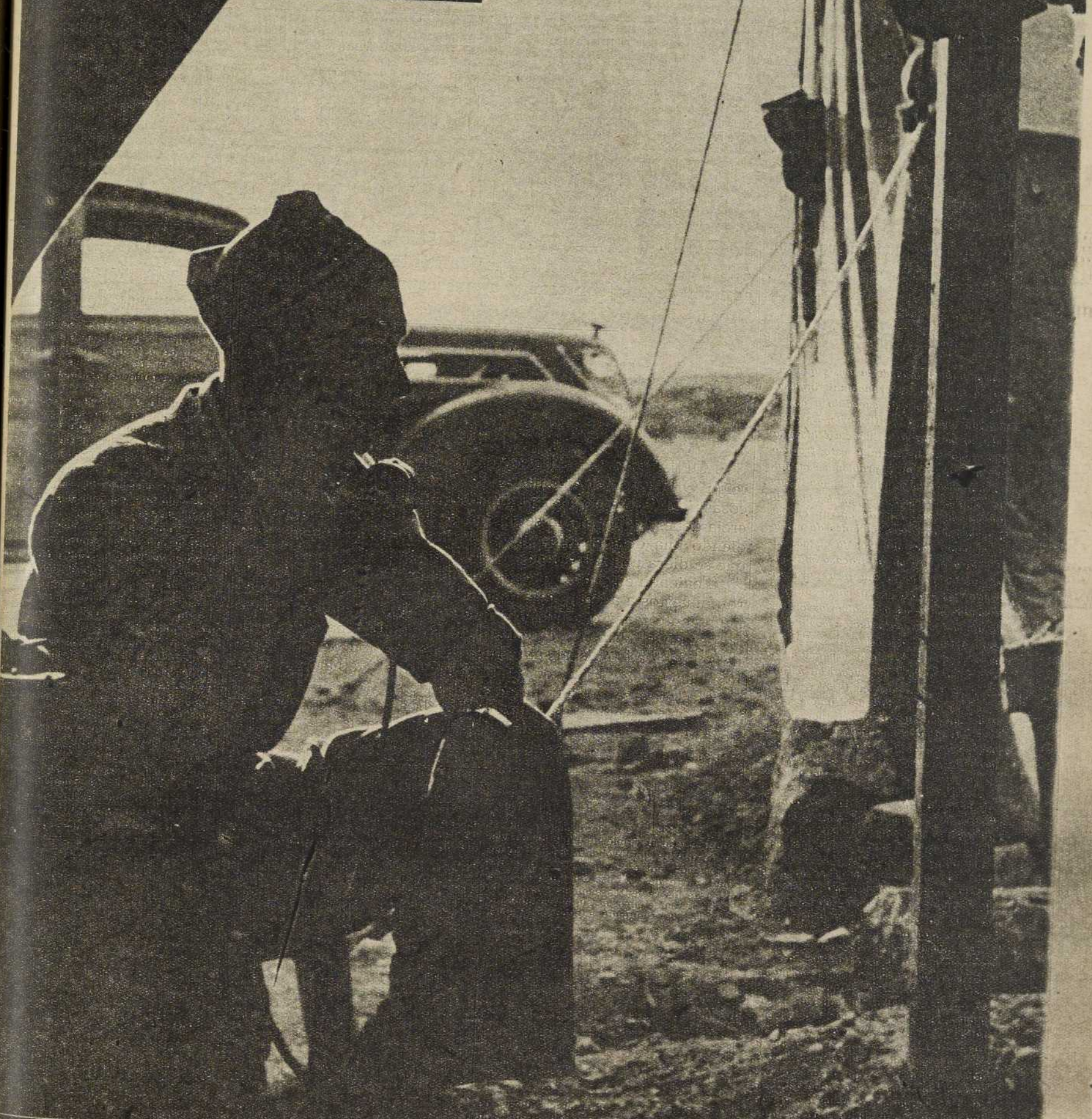
NOCHE Y DIA, EN EL FUEGO DEL COMBATE Y EN LAS HORAS DE CALMA, EL SOLDADO DEL PUEBLO NO TIENE MAS QUE UNA PREOCUPACION: VENCER