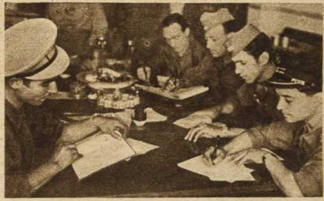
El enemigo ha abandonado con la casa cuanto en ella había. Hoy sirve a maravilla esta mesa para el trabajo de los oficiales, y en otros momentos como escuela de los soldados de la República