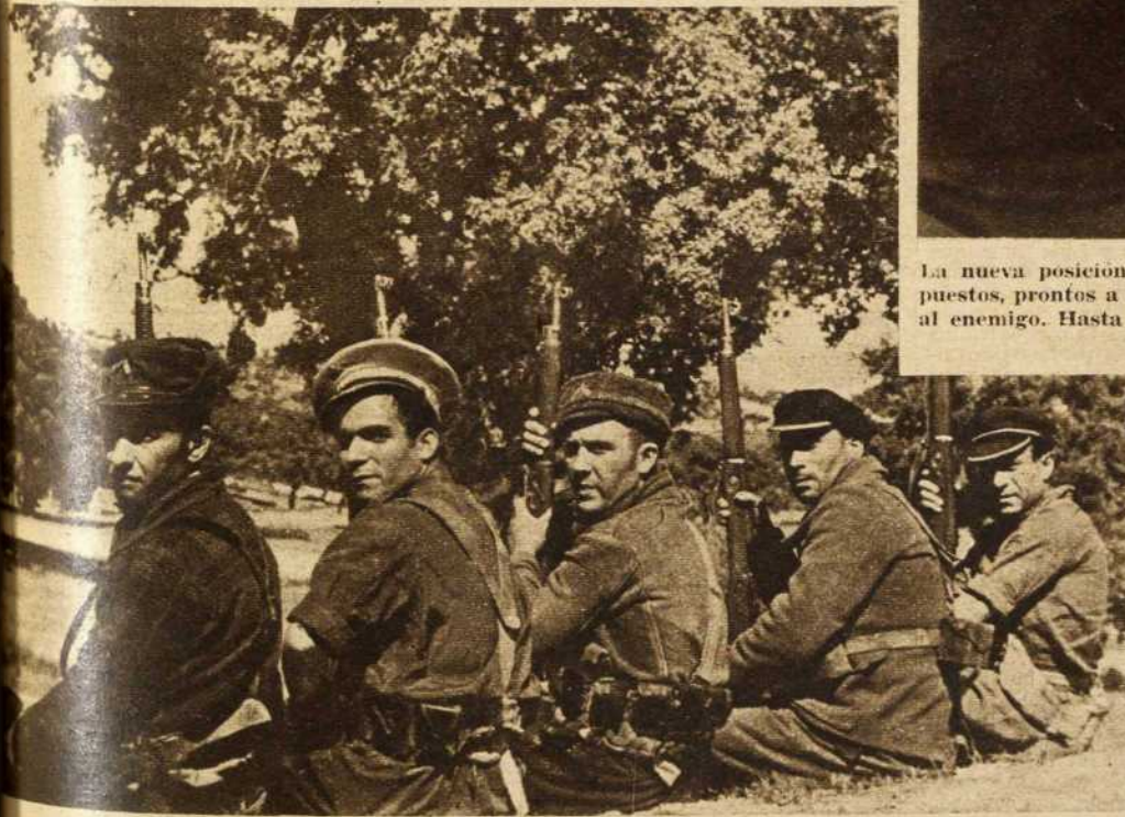
Dirigidos por el comandante, los cinco veteranos que conquistaron la Casa de la Embajada de Cuba, que han sido propuestos por el jefe de la División para el ascenso inmediato. Los dos últimos son camaradas españoles que vinieron desde Nueva York a luchar enrolados en las filas del Ejército del pueblo