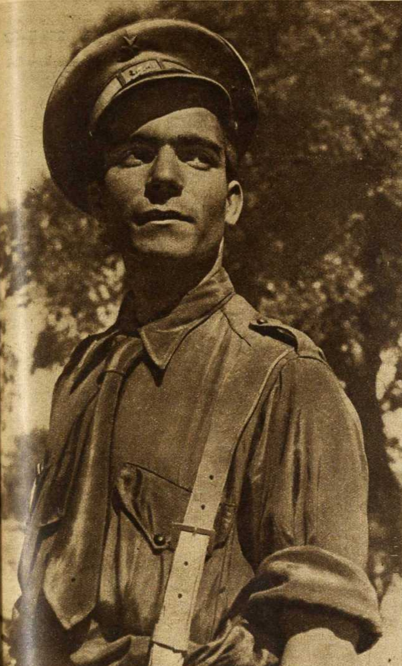
El teniente "Sevilla" es uno de los magníficos tipos que se encuentran al recorrer las trincheras populares. "Valiente, me repiten constantemente los jefes, y con una historia llena de incidentes que él convierte en divertidos, a pesar que nunca fueran agradables"