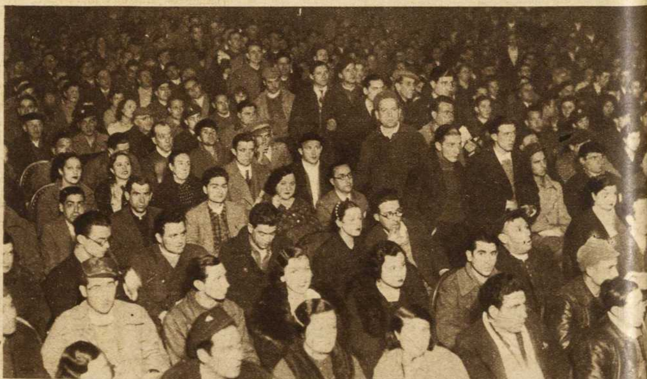
La heroica juventud de Madrid, que por su abnegación y heroísmo es un ejemplo vivo para toda la juventud española, una vez más muestra su identificación plena con la Comisión Ejecutiva de la unidad, con los acuerdos del Comité Nacional de las Juventudes Socialistas Unificadas