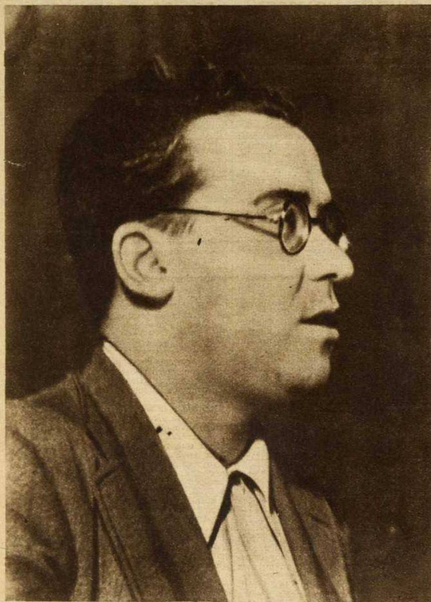
Santiago Carrillo habla ante la heroica juventud de Madrid: "Los enemigos de la unidad se estrellarán ante la firmeza de los 150.000 jóvenes que tenemos en la línea de fuego"