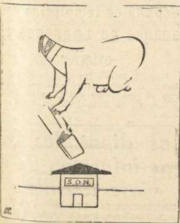
El Libro Blanco en Ginebra

de San Pedro, y consiguió volar un polvorín enemigo.