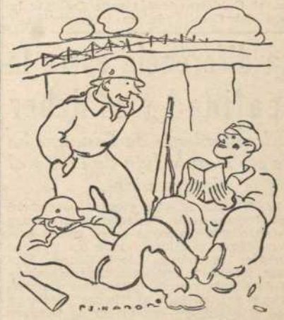
Sin "guerra" en la mayoría de los frentes