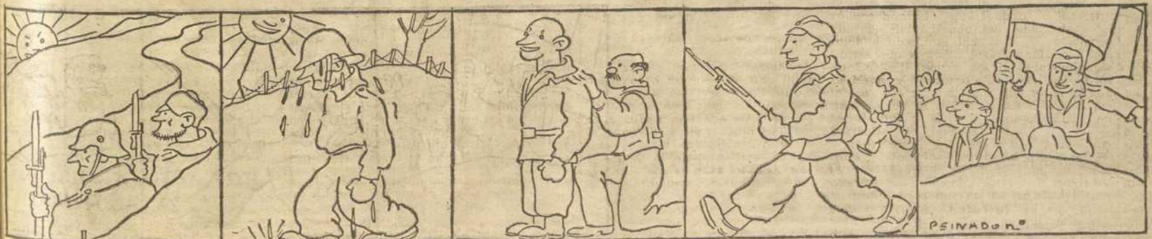
Ya pasa la primavera y da el sol en la trinchera,