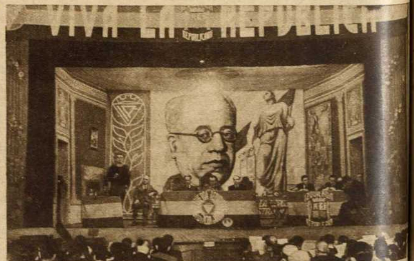
He aquí un aspecto de la presidencia del mitin que Izquierda Republicana celebró el pasado domingo, y en el que este partido fijó su posición en los actuales momentos