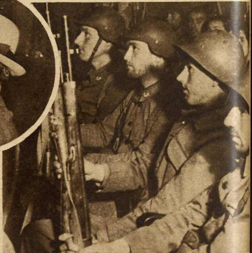
Veteranos de nuestro Ejército popular, representantes del pueblo en armas, en acto de homenaje a la Unión Soviética, que se celebró—en medio de una emoción fervorosa—en un local de Madrid...