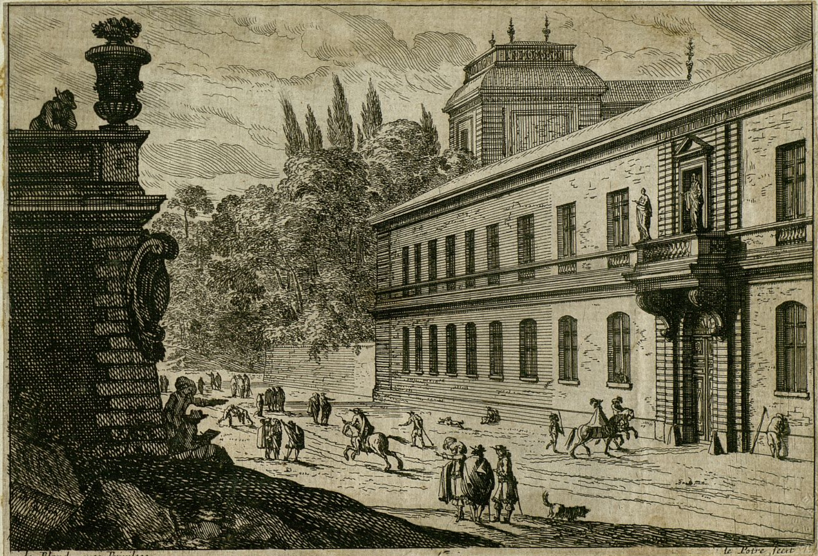
le Blond avec Privilège