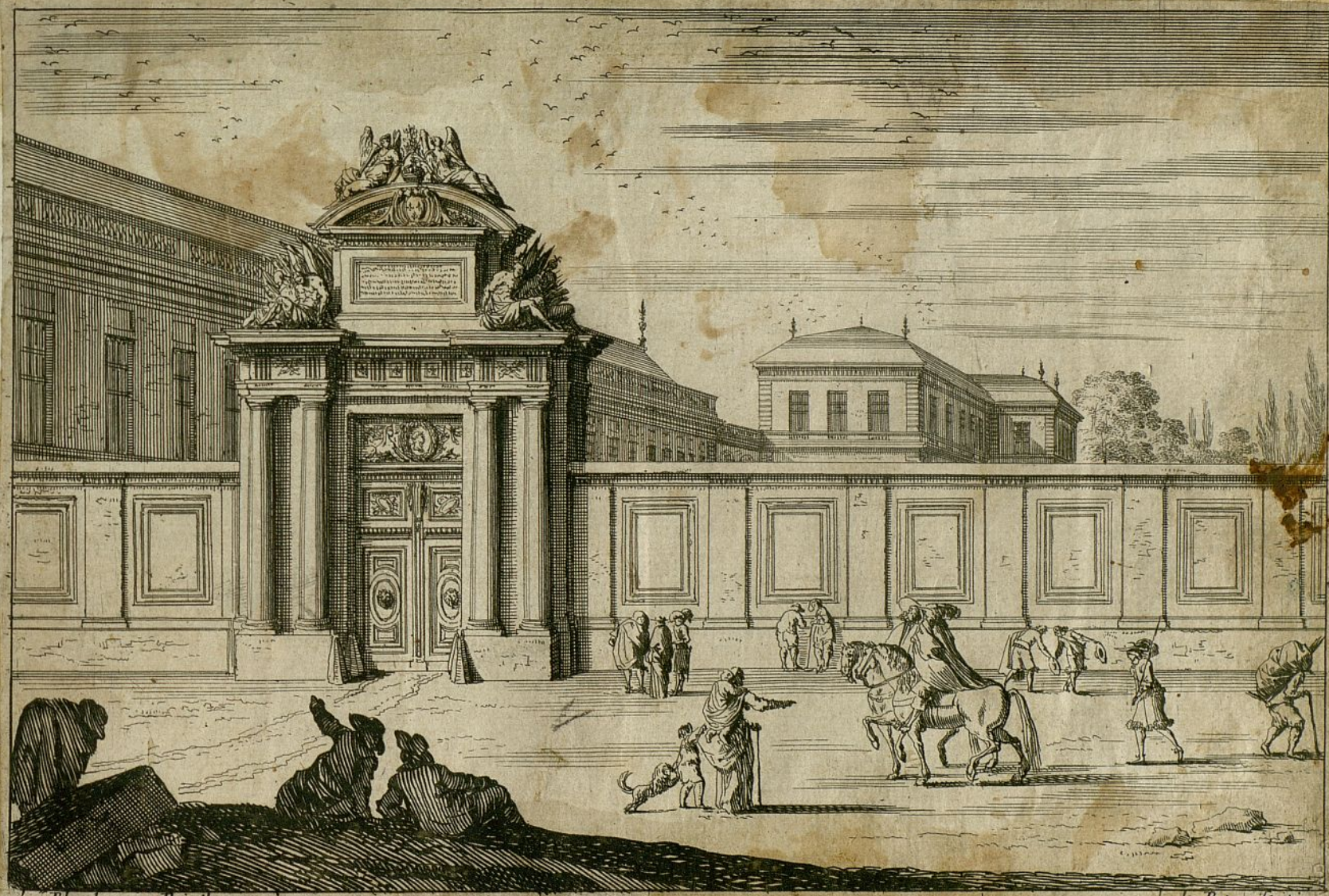
le Blond avec Privilège