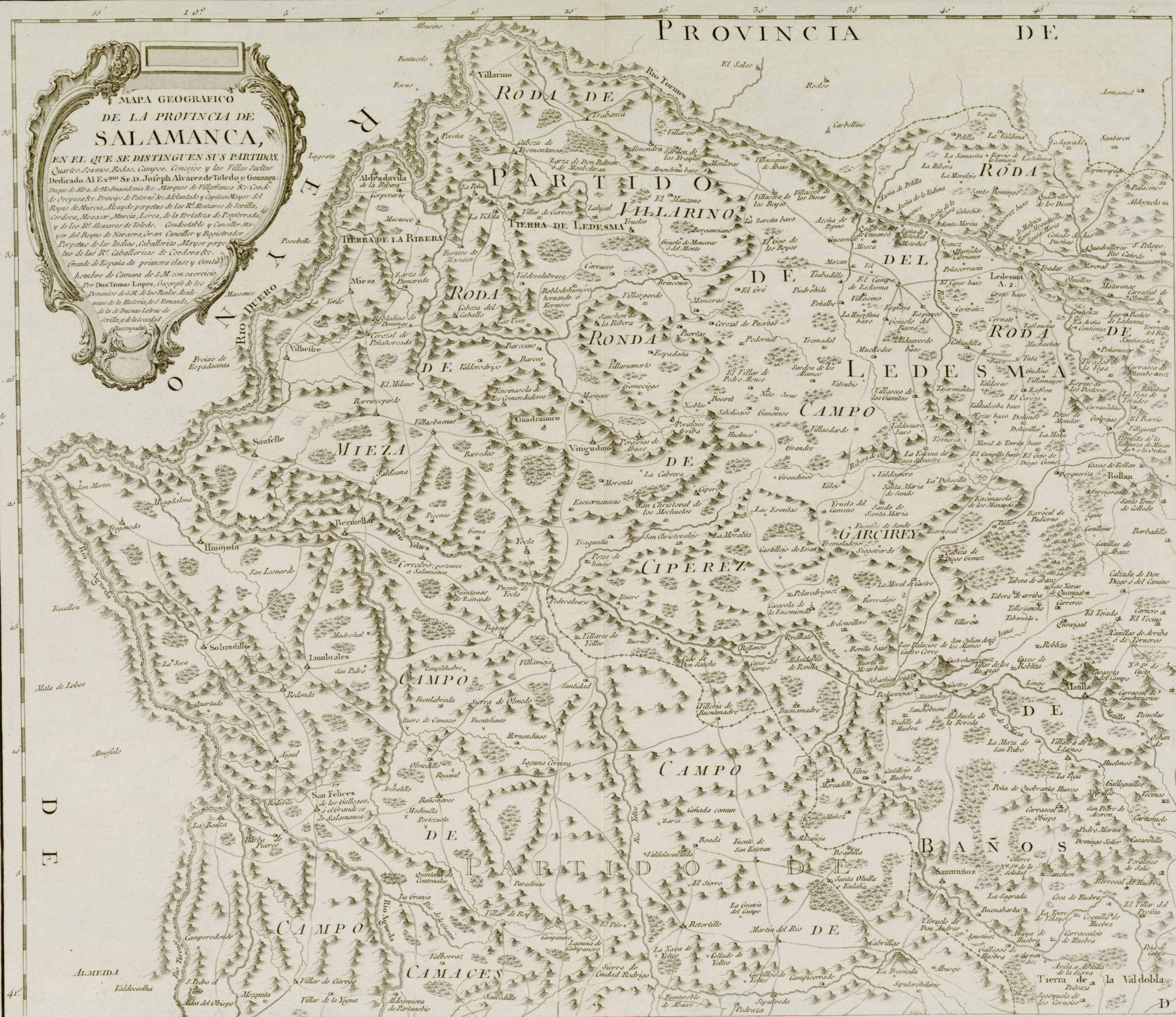
Primera de Salamanca.

REPUBLICA DE CHILE MINISTERIO DE INTERIORES 18956 SANTIAGO